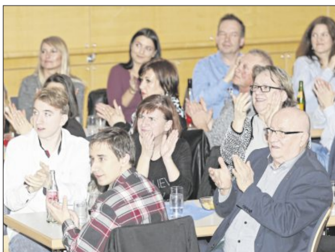
Das Publikum in der beinahe voll besetzten Stadthalle hat einen Abend mit kurzweiligen Showeinlagen genossen.