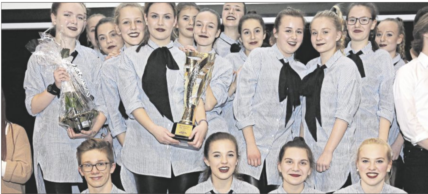
Die Vaihinger Tanzgruppe Fame hat bei der VKZ-Leserwahl deutlich gewonnen und wurde in der Stadthalle als Mannschaft des Jahres ausgezeichnet.